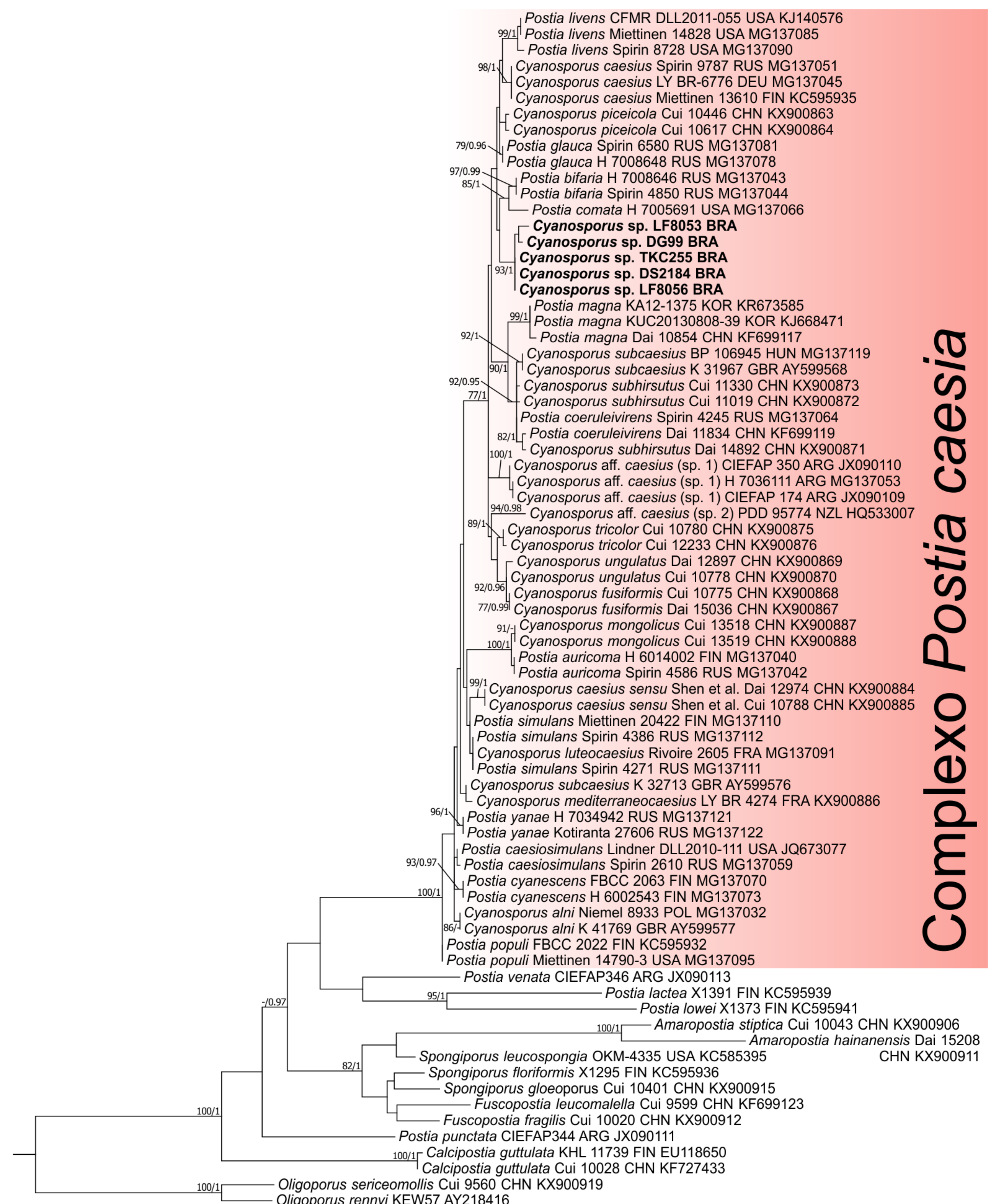
Figura 3: Reconstrução filogenética do complexo Postia caesia / Cyanosporus e gêneros próximos inferida a partir do marcador molecular ITS. A topologia apresentada é da análise de máxima verossimilhança. Apenas os valores de sustentação iguais ou maiores que 0.95 para probabilidade posterior e 75 para bootstrap são exibidos acima dos ramos. Os terminais em negrito representam sequências obtidas neste estudo.